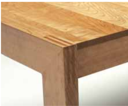
Modell 100: Klassische X-Pand Linie