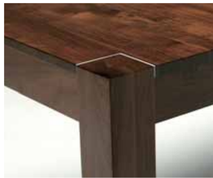
Modell 200: Moderne X-Pand Linie

Die X-Pand Möbellinie für den Innenbereich ist in unterschiedlichen Modellen und mit flexiblen Tischlängen am Markt. Entsprechend den persönlichen Lebensbedürfnissen, dem individuellen Wohnambiente und den persönlichen Anforderungen an modernes Einrichten. Das X-Pand System umfasst massive Esstische und Sitzbänke in unterschiedlichen Holzarten und Längen.